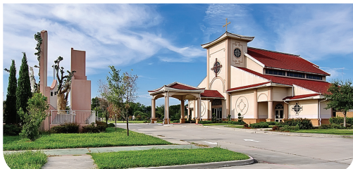
GIÁO XỨ ĐỨC MẸ LA VANG - WWW.LAVANGCHURCH.ORG

Bí Tích này trong bữa tiệc ly như là Giao Ước mới. Trước khi dâng mình hiến tế trên thánh giá, Chúa Giêsu đã lập Bí Tích Thánh Thể trong bữa Tiệc Ly. Bánh và rượu là của ăn, của uống nuôi sống chúng ta hằng ngày. Hình ảnh tấm bánh được kết thành bởi muôn hạt miễn và chén rượu được ép bởi muôn ngàn trái nho chín. Chúa dùng cả bánh và rượu để biến đổi nên Mình và Máu Thánh Chúa.